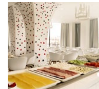
Zaskakujące rozwiązania – stoliki na suficie