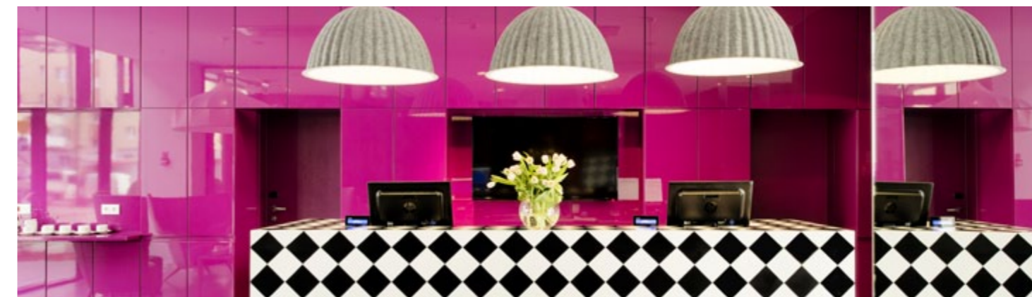
Wyrazista recepcja z lustrzanym efektem