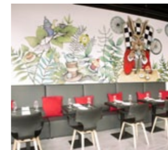
Nowoczesne wzornictwo mebli w baśniowym otoczeniu