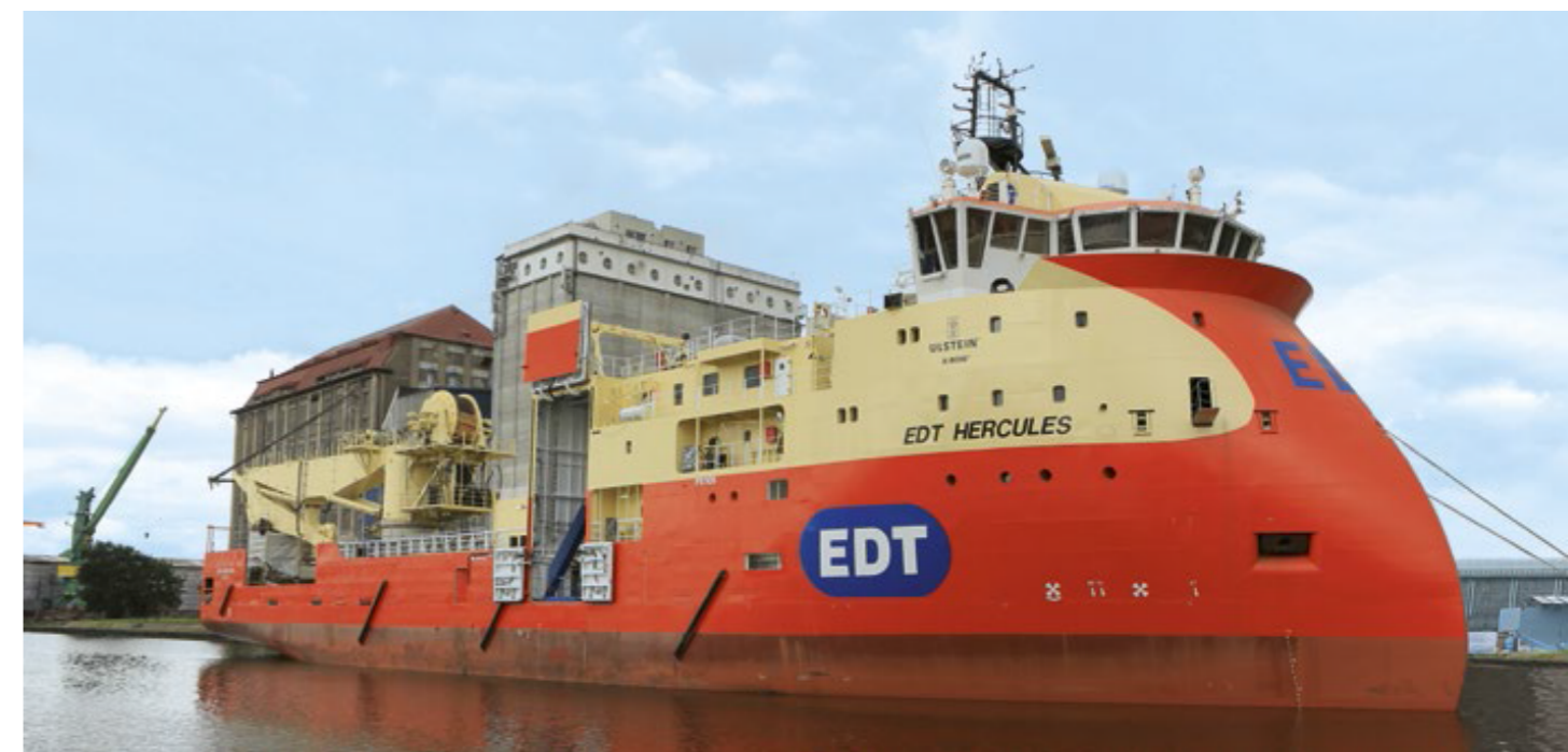
EDT Hercules - zaopatrzeniowiec offshore