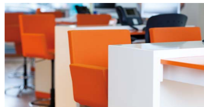
Biurka wykonane z płyty MDF, polakierowano emalią na wysoki połysk.