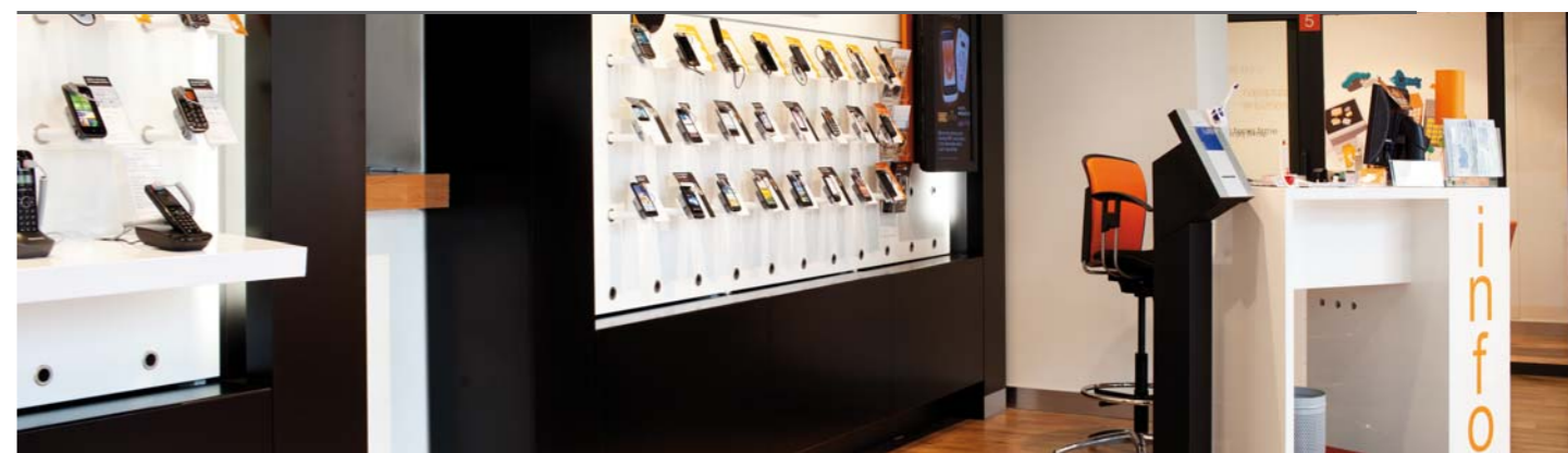
Panele ekspozycyjne z płyty MDF na metalowej konstrukcji wraz z elementami mocującymi akcesoria ze szlifowanej stali nierdzewnej.