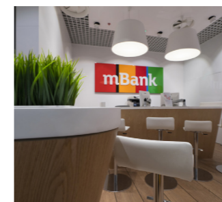
Lada do obsługi klienta