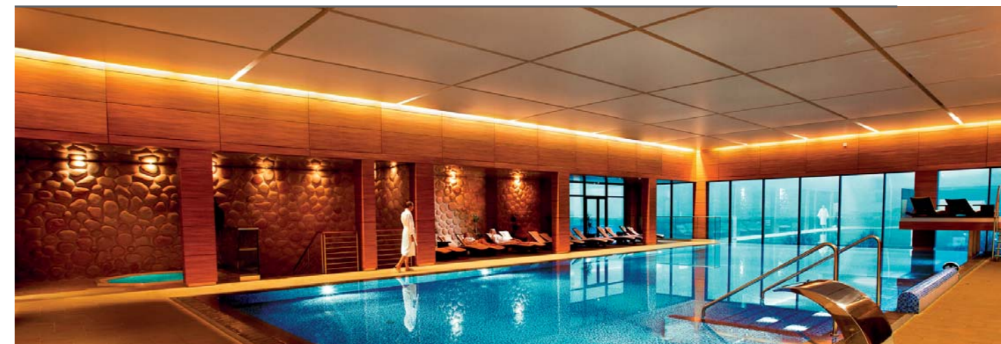
Przeszkłona ściana basenu z krawędzią przelewową gwarantuje niezapomniany widok na panoramę Kielc. Pozostałe ściany wyłożono setkami metrów kwadratowych boazerii płytowej.