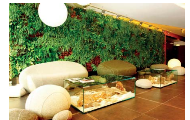
Holl recepcji - ściany żywych roślin oprawionych w boazerię płytową.