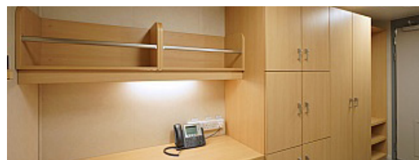
Kompleksowe wyposażenie części załogowych.