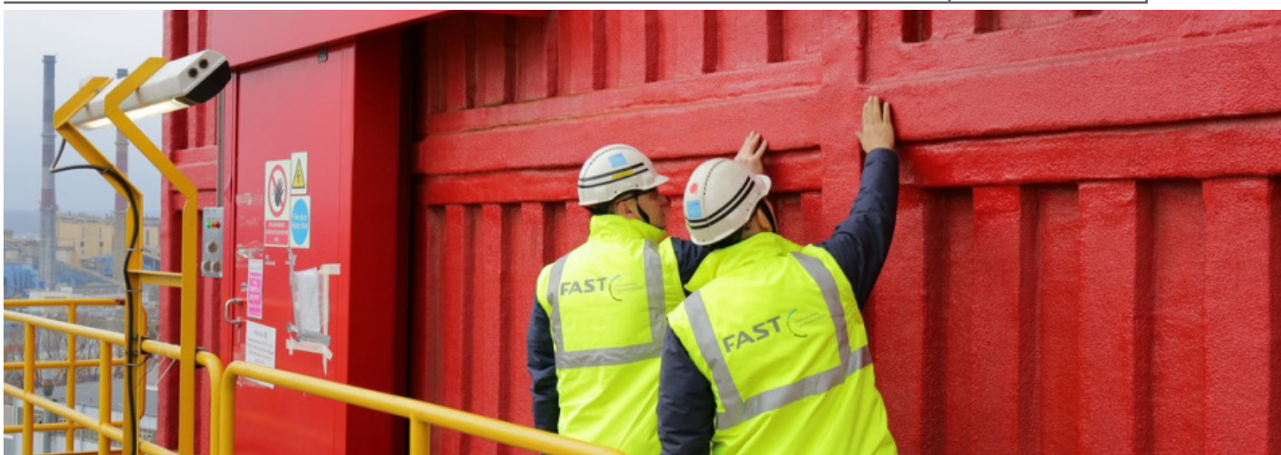
Kompleksowe zabezpieczenia antykorozyjne, w tym aplikacja powłok PFP.

W październiku 2013 ruszyła realizacja projektu przebudowy platformy PPF-1 (należącej do Ithaca Energy) na zlecenie Gdańskiej Stoczni Remontowej SA. Jednostka o długości 82 m, szerokości 75 m, wysokości 30 m i wyporności 26 639 t trafi na pola naftowo-gazowe firmy Greater Stella Area w brytyjskim sektorze Morza Północnego. Remont ma znacznie zwiększyć jej zdolności wydobywcze, ale nie tylko - po przebudowie stanie się ona małą rafinerią.